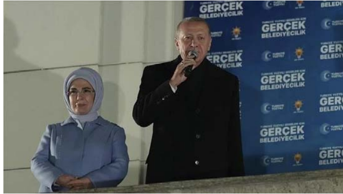
اردوغان به همراه همسرش