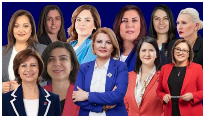
در ۱۱ استان ترکیه زنان توانستند به‌عنوان شهردار انتخاب شوند

این حزب یکی از مشارکت‌کنندگان در کنگره دموکراتیک خلق‌ها (HDK) یک ابتکار عمل سیاسی است که در تاسیس حزب دموکراتیک خلق‌ها (HDP) در سال ۲۰۱۲ موثر بود. حزب برابری و دموکراسی خلق‌ها در ۱۵ اکتبر ۲۰۲۳ نام خود را از حزب چپ سبز و آینده به حزب «برابری و دموکراسی خلق‌ها» تغییر داد و در همان کنگره تولای حاتموغولری و تونجر باکرهان به‌عنوان رهبران مشترک این حزب انتخاب شدند.