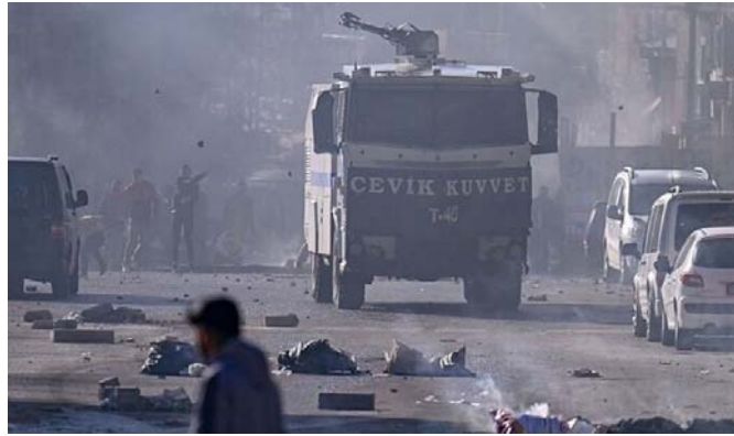
جنگ خیابانی مردم وان با نیروهای سرکوبگر و پلیس ضدشورش

۳۶ حزب شرکت‌کننده در انتخابات گرایش‌ها و اهداف سیاسی متفاوتی دارند: از احزاب راست افراطی و فاشیستی گرفته تا چپ ناسیونالیست و سوسیالیست؛ از احزاب لیبرال گرفته تا احزابی که آشکارا هوادار خلافت اسلامی هستند. با این همه، احزاب اصلی در ترکیه امروز چهارتاست: حزب حاکم عدالت و توسعه (AKP)؛ حزب جمهوری خلق (CHP)؛ حزب حرکت ملی‌گرا (MHP)؛ و حزب برابری و دموکراسی خلق‌ها (DEM) که به‌طور عمده مردم کرد ترکیه را نمایندگی می‌کند.