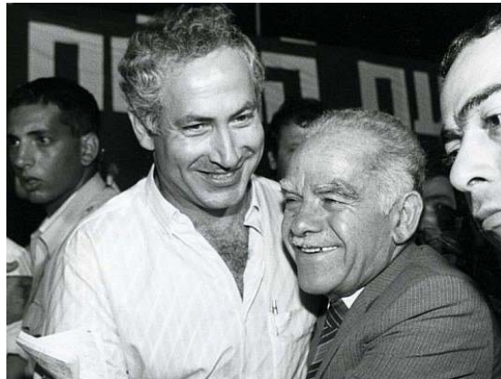
بنیامین نتانیاهوی جوان و اسحاق شامیر

در نوامبر ۱۹۴۷، مجمع عمومی سازمان ملل متحد طرحی را برای تقسیم فلسطین به دو منطقه یهودی و عربی برای تشکیل یک کشور دو ملیتی تصویب کرد. دیوید بن گوریون از کنده عمل سازمان بین دولتی استفاده کرد و در ۱۴ مه ۱۹۴۸ یکجانبه تأسیس کشور اسرائیل را اعلام کرد. پاسخ کشورهای عربی مسلحانه بود و شبه نظامیان یهودی اقدام به بیرون راندن ۷۵۰ هزار فلسطینی کردند که نکه نام گرفت. مجمع عمومی سازمان ملل متحد که از این تحولات سریع نگران شده بود، یک نماینده سوئدی، کنت فولکه برنادوت Folke Bernadotte، را برای تعیین مرز بین دو کشور اعزام کرد. اما روز ۱۷ سپتامبر ۱۹۴۸، «صهیونیست‌های رویونیست» دیگر که به گروه لعی Lehi (معروف به «گروه اشترن») تعلق داشتند و تحت فرماندهی نخست وزیر آینده دیگر، اسحاق شامیر بلاروس بودند، او را ترور کردند. همه آنها توسط یک دادگاه اسرائیلی محکوم شدند. موشه شرتوک (یا شارِت) وزیر امور خارجه اوکراین در نامه ای به مجمع عمومی خواستار عضویت اسرائیل در سازمان ملل شد. او اعلام کرد که «بدینوسیله دولت اسرائیل تعهدات ناشی از منشور سازمان ملل متحد را بدون قید و شرط می‌پذیرد و متعهد می‌شود از روزی که به عضویت سازمان ملل متحد درآید، از آنها پیروی کند». تحت این شرایط صریح، اسرائیل در ۱۱ می ۱۹۴۹ به عضویت سازمان ملل متحد درآمد. در روزهای بعد، یوشوا کوهن، قاتل کنت برنادوت، بی سر و صدا آزاد شد و بعد عهدهدار محافظت از دیوید بن گوریون نخست وزیر این کشور گردید.