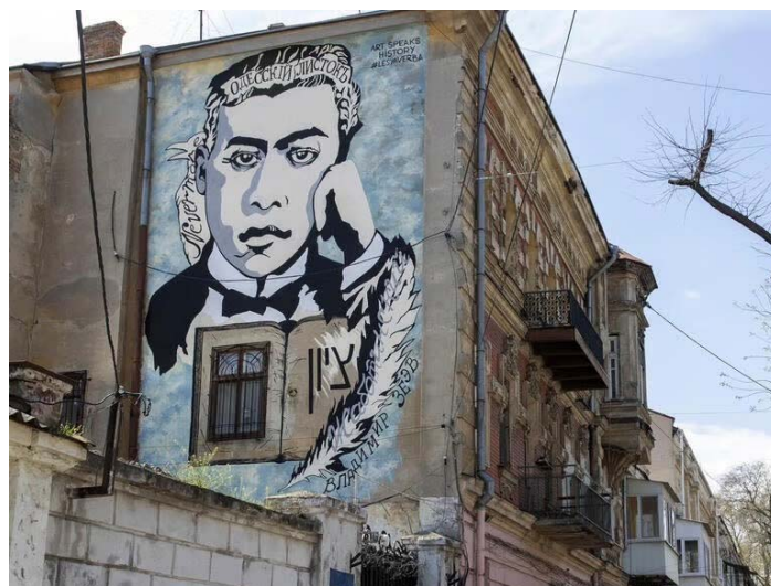
نقاشی دیواری به افتخار ولادیمیر ژابوتینسکی در اودسا (اوکراین)

با این حال، دولت «پروتستان‌های سرکش» دیوید لوید جورج، هربرت ساموئل را به عنوان فرماندار فلسطین منصوب کرد. او بلافاصله پس از ورود به اورشلیم، دوستش ژابوتینسکی را عفو و از زندان آزاد کرد و سپس محمد امین الحسینی ضد یهود و بعدها همکار رایش هیتلری را به عنوان مفتی اعظم بیت المقدس منصوب کرد.