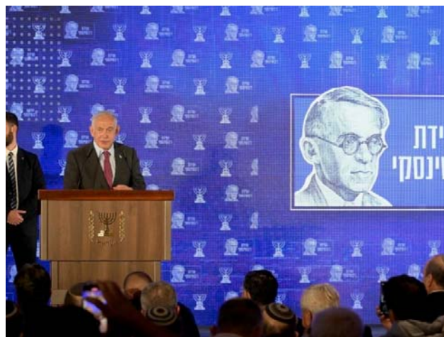
بنیامین نتانیاو مرشد خود ولادیمیر زنف ژابوتینسکی را می ستاید

ولادیمیر ژابوتینسکی در سال ۱۹۴۰ در نیویورک درگذشت. دیوید بن گوریون با بازگرداندن خاکستر او به اسرائیل مخالف بود، اما در سال ۱۹۶۴، نخست وزیر وقت اسرائیل، لوی اشکول Levi Eshkol، با انتقال خاکستر او را به اسرائیل موافقت کرد.