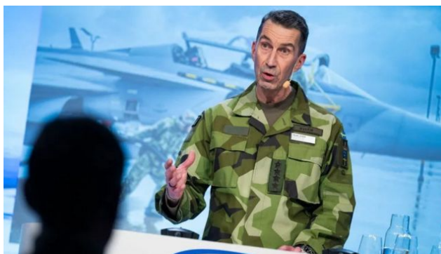
جنرال مایکل بیدن

جنرال بیدن، یک ماه پیش از آن تاریخ، از جبهه شرقی اوکراین بازدید کرد و سویدن یکی از کشورهای است که خلبانان اوکراینی را آموزش می‌دهد. گفته می‌شود استکهلم نیز در حال بررسی ارسال جنگنده‌های پیشرفته گریپن به اوکراین است.