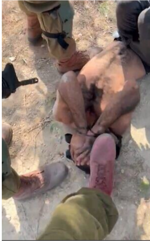
فلسطینی بازداشت شده در کرانه غربی رود اردن