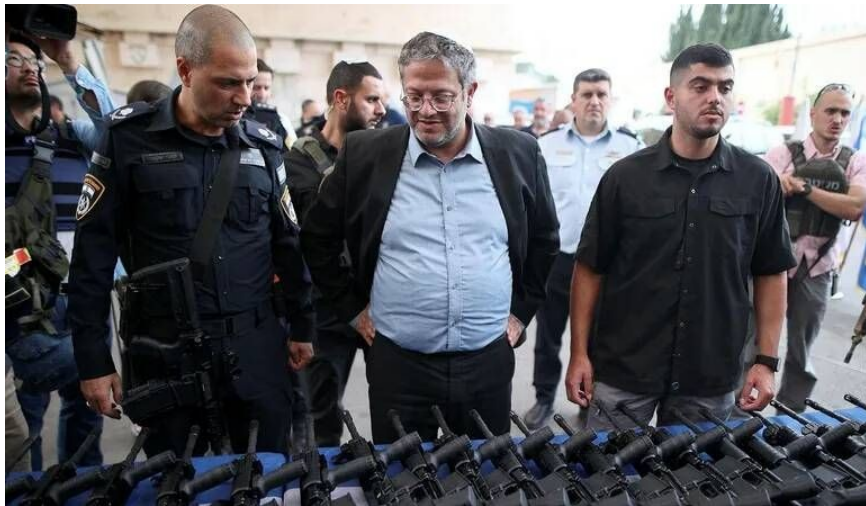
بن گویر بین شهرکنشینان سلاح توزیع می‌کند

حامیان خود را «تحریک می‌کنند». به ویژه، بن گویر، به عنوان وزیر امنیت ملی، قصد دارد ده‌ها هزار سلاح خودکار قوی‌تر از سلاح‌های قبلی بین شهرکنشینان توزیع کند. سموتریچ به عنوان مقام مدیریت امور مالی، دائماً از انتقال هر گونه وجه به تشکیلات خودگردان فلسطین جلوگیری می‌کند.