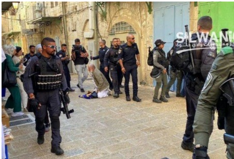
یورش به بخش عربی بیت المقدس

علاوه بر این، ترور واقعی علیه فلسطینیان در کرانه غربی رود اردن توسط شهرکنشینان یهودی از کیبوتسیمها («پسران کوهستان») که زمینهای آنها را به طور غیرقانونی اشغال کردهاند، به راه افتاده است. آنها زمینهای کشاورزی را ویران میکنند، خانهها را به آتش میکشند، به ساکنان آنها شلیک میکنند و همسایگان عرب خود را اخراج میکنند. جمعیت شهرکنشینان یهودی در اینجا در حدود ۷۰۰ هزار نفر است و همه آنها بدون استثناء مسلح هستند. همین گروه از مردم، پایگاه اصلی انتخاباتی و پشتیبان دو حزب ضد فلسطینی ائتلاف حاکم در اسرائیل: «قدرت یهود» «ایتامور بن گویر و» «صهیونیزم مذهبی» «بترال سموتریچ را تشکیل می دهند. این دو حزب به هر طریق ممکن