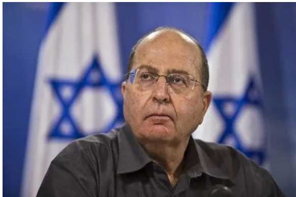
موشه «بوگی» یعلون

می‌تواند گرایش غرب نسبت به «تنها دموکراسی» در خاورمیانه را یک شبه تغییر دهد. اما گزینه‌های بسیار شدیدتر دیگر نیز وجود دارند.