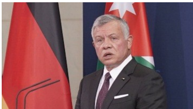
ملک عبدالله دوم، پادشاه اردن

تحمل خواهد بود. مخالفت آن‌ها با باز شدن گذرگاه مرزی رفح بیهوده نیست. مگر با ارسال کمک‌های بشر دوستانه – با برداشته شدن کامل محدودیت‌ها نمی‌توان جلوی بهمن مردم را گرفت؟ حماس به لحاظ تاریخی شاخه فلسطینی «اخوان المسلمین» مصر (ممنوعه در روسیه)، دشمن قسم‌خورده رئیس جمهور السیسی است. مصر در حال حاضر با مشکلات زیادی برای مهار فعالیت خود در سینا، که مقامات رسمی، عمدتاً تنها منطقه تفریحی شرم الشیخ را کنترل می‌کنند، مواجه است. ورود هزاران اسلام‌گرای مسلح جدید براحتی می‌تواند کشور را به ورطه جنگ داخلی بکشاند. السیسی در ۱۷ اکتوبر در دیدار با اولاف شولتز صدراعظم المان در قاهره نیز گفت: «انتقال شهروندان فلسطینی از نوار غزه به صحرای سینا صرفاً به معنای انتقال مبارزه و مقاومت از غزه به سینا است و در نتیجه، سینا به یک پایگاه برای عملیات نظامی علیه اسرائیل تبدیل خواهد شد». و لذا در این صورت، «اسرائیل سعی خواهد کرد با اعزام نیروهای مسلح خود به مصر و سینا از خود دفاع کند». به این ترتیب، او دورنمای یک جنگ احتمالی جدید مصر و اسرائیل را ترسیم کرد. مصری‌ها نیز آشکارا از موضع غرب به رهبری امریکا که نه خواهان لغو طرح اخراج، بلکه، فقط می‌خواهند زمان اضافی برای اجرای آن داده شود، آزوده خاطر هستند و می‌گویند آن‌ها در عرض یک روز نمی‌توانند خارج شوند. در ضمن، تهدید مصر برای انتقال پناهیویان به اروپا زمانی که آن‌ها به راندن مردم غزه به خاک این کشور شروع می‌کنند، کاملاً واقعی است. البته، اگر صدها کشتی حامل فلسطینی‌ها را هنگام حرکت به سواحل اروپا غرق نکنند، می‌تواند یک سنگ تمام عیار اخلاقی باشد.