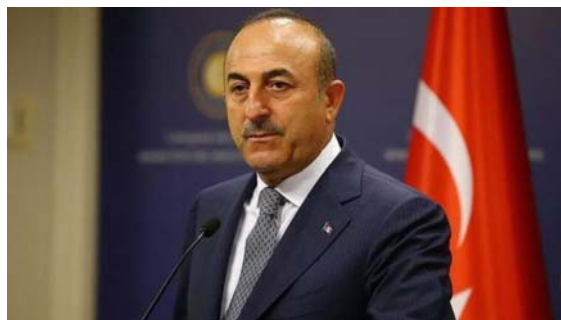
مولود چاووش اوغلو

اهمیت این موضوع برای دستور کار داخلی ترکیه، با توجه به بار اقتصادی ترکیه برای حمایت از ۴ میلیون پناهنده سوریه و کل هزینه مداخله در سوریه، این واقعیت را نیز نشان می‌دهد که انقراض خواستار برگزاری اجلاس چهارجانبه بعدی برای حل و فصل بحران سوریه قبل از انتخابات است. ۱۰ مه، مولود چاووش اوغلو، وزیر امور خارجه ترکیه در جلسه مسکو شرکت کرد و آن را به عنوان یک گام مهم در جهت پایان دادن سریع به بحران سوریه به مردم ترکیه ارائه داد. چاووش اوغلو در مصاحبه با سی ان ان ترک در ۹ مه گفت که یکی از موضوعات اصلی که او در باره آن صحبت خواهد کرد، بازگشت آوارگان سوریه خواهد بود. وی همچنین اظهار داشت که اجلاس رهبران ترکیه و سوریه ممکن است در سال ۲۰۲۳ برگزار شود و به طور ضمنی گفت که این اردوغان است که از طرف ترکیه در آن شرکت خواهد کرد.