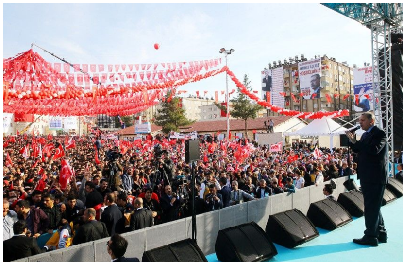
اردوغان در تجمع انتخاباتی

بر اساس اکثر نظرسنجی‌های ترکیه در ماه مارچ تا اپریل، نامزد ائتلاف ملی مخالف، مرکب از ۶ حزب، کمال قلیچداراوغلو، رئیس حزب جمهوری خلق ۵۵-۵۳ درصد با اطمینان پیش‌تاز بود. در ۴ مه، ممنوعیت نظرسنجی‌ها تا پایان رأی‌گیری به اجراء درآمد. در این روز، رأی هر دو نامزد اصلی تقریباً برابر بود و در برخی از آن‌ها، اردوغان با ۴۷.۸٪، ۵۱٪، حتی بر رقیب اصلی (۴۵.۴٪) پیشی گرفت. در عین حال، فرض بر این است که اکثریت افراد بالاتکلیف نیز به رئیس‌جمهور فعلی رأی خواهند داد. در هر صورت، پویائی به نفع اوست. علاوه بر این، در صفوف ائتلاف اپوزیسیون متفرق، با متحد کردن چپ‌ها و راست‌های افراطی، سکولارها و بنیادگرایان مذهبی در صفوف خود، دعوای حتی قبل از انتخابات آغاز شد. در آستانه انتخابات، بر اساس همین نظرسنجی‌ها، ائتلاف مردمی به رهبری اردوغان که هسته اصلی آن را حزب عدالت و توسعه تشکیل می‌دهد، با اطمینان پیش‌تاز بود و این، شانس او را برای پیروزی در انتخابات ریاست جمهوری افزایش می‌دهد. یکی از مهمترین استدلال‌های آن‌ها علیه اپوزیسیون این است که ظاهراً با حزب کارگران کردستان تبنانی کرده و قصد دارد رهبر آن، عبدالله اوجلان را که به حبس ابد محکوم است، عفو کند. این اتهام به ویژه متوجه حزب دموکرات خلق‌ها است که به طور سنتی از سوی اقلیت کُرد حمایت می‌شود. این حزب به طور رسمی خارج از «ائتلاف ملی» باقی می‌ماند، اما از نامزدی قلیچداراوغلو حمایت می‌کند.