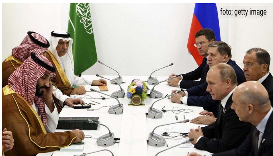
محمد بن سلمان، ولیعهد عربستان سعودی و ولادیمیر پوتین

عربستان سعودی از طریق اوپک و از منظر منافع خود در تجارت نفت، همکاری نسبتاً نزدیکی با روسیه دارد. آخرین تصمیم عربستان سعودی برای کاهش تولید نفت روزانه به میزان ۵۰۰ هزار بشکه دیگر، ضربه دیگری به روابط پر تشنج بین واشنگتن و ریاض بود که «در نتیجه وخیم‌تر شدن آن در دولت جو بایدن، عربستان سعودی به روسیه و چین نزدیکتر شده است».