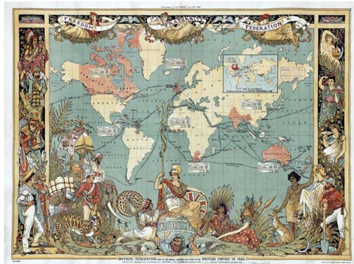
[Walter Crane/Wikipedia] حکومت انگلیس در جهان

با این وجود، هجوم کمی به کیفیت فرارونید در عوض، هرج و مرج حاکم بر دولت امریکا را نشان داد و یک بار دیگر سعودی‌ها را متقاعد کرد که واشینگتن «دیگر همان نیست». اخیراً ولیعهد با پوتین تماس گرفت و ظاهراً او را از این «جهش عجیب» آگاه ساخت و تأکید کرد که ریاض قصد ندارد در تصمیمات خود تجدید نظر کند.