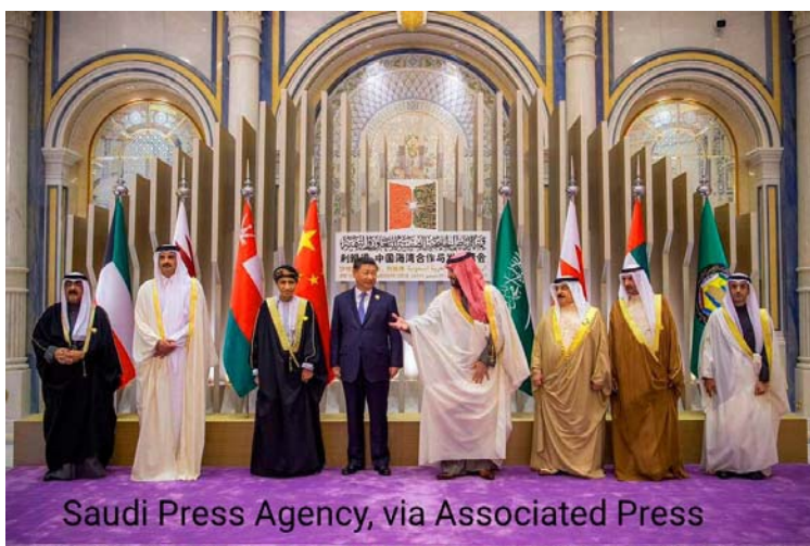
دیدار شی جین‌پینگ با رهبران کشورهای حوزه خلیج فارس در ریاض

عربستان سعودی از طریق اوپک و از منظر منافع خود در تجارت نفت، همکاری نسبتاً نزدیکی با روسیه دارد. آخرین تصمیم عربستان سعودی برای کاهش تولید نفت روزانه به میزان ۵۰۰ هزار بشکه دیگر، ضربه دیگری به روابط پر تشنج بین واشنگتن و ریاض بود که «در نتیجه وخیم‌تر شدن آن در دولت جو بایدن، عربستان سعودی به روسیه و چین نزدیکتر شده است».