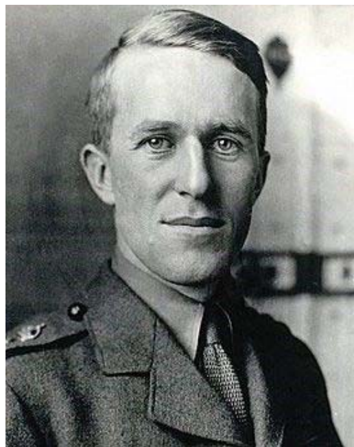
توماس ادوارد لارنس (عربستان)

کشورهای خاورمیانه مدت‌هاست از اراده و آداب و رسوم بیگانه که از بیرون بر آنها تحمیل شده، خسته شده‌اند. این تمایلات به موازات کاهش قدرت اقتصادی و نظامی غرب رشد کرد. بیش از یک دهه پیش، با تحریک مستقیم امریکا، تلاش برای دگرگونی منطقه با شعار «بهار عربی» برای معکوس کردن این روندها شروع شد، اما بی‌نتیجه بود. امروز، ظرفیت خرابکارانه بهار عربی کاملاً از بین رفته است. خاورمیانه «تهاجم ترکیبی» به امور خود را تجربه کرده و آخرین لکه‌هایش را از تن خود می‌زداید. بازگشت قریب‌الوقوع سوریه به جهان عرب و صحبت‌های آشتی میان همسایگان در سراسر منطقه به این امر پایان داد. نتیجه یک دهه پرتلاطم این است که کشورهای خاورمیانه، از جمله قدرتمندترین آنها، عربستان سعودی، با قدرت بیشتری به تلاش برای حاکمیت کامل ادامه داده‌اند. به هر حال، نخبگان بومی منشاء حمله «ترکیبی» را به خوبی می‌شناسند.