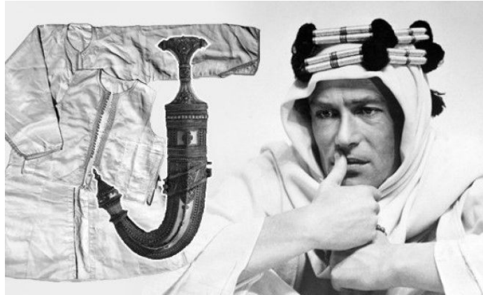
پیتر اوتول در نقش لارنس عربستان