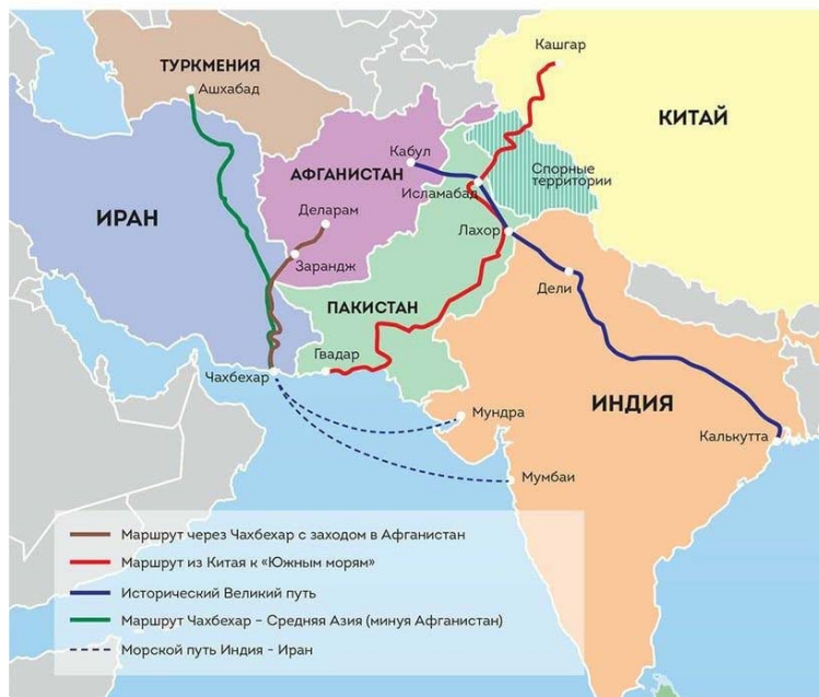
Индостан - перспективные торговые маршруты

به گزارش نشریه «ترکمنستان بی‌طرف»، رئیس مجلس (رئیس جمهور سابق و پدر رئیس جمهور فعلی) چشم‌انداز خوب مشارکت سودمند دوجانبه در حوزه تجاری و اقتصادی، حمل‌ونقل و ارتباطات و لجستیک در مجتمع کشت و صنعت را یادآور شد. اخیراً سردار بردی‌محمداف، رئیس جمهور ترکمنستان اسناد مربوط به ساخت تأسیسات جدید پزشکی مدرن را امضاء کرد. در جریان سفر میخائیل میوشوستین، نخست وزیر روسیه به عشق‌آباد در ماه جنوری، ۸ توافقنامه بین بخشی امضاء شد.