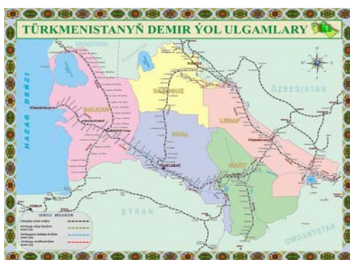
شریان‌های ریلی حمل و نقل ترکمنستان

دونالد لو ، دستیار وزیر امور خارجه - رئیس دفتر امور آسیای جنوبی و مرکزی وزارت امور خارجه در تاریخ ۶ نومبر در عشق‌آباد سخنرانی کرد. او در بخشی سخنان خود گفت: «... ایالات متحده در نظر دارد به ترکمنستان کمک کند تا از فشار تحریم‌ها علیه روسیه بهره‌مند شود. خوشحال خواهیم شد که به همکاری با دولت ترکمنستان و جامعه تجاری آن برای کمک به آن‌ها برای خروج بیشتر از رژیم تحریم‌ها ادامه دهیم». این امریکائی همچنین با اشاره به «منافع» قزاقستان همسایه در نتیجه خروج بسیاری از بانک‌های بزرگ روسیه از آنجا در تابستان-پائیز ۲۰۲۲ گفت: «به ترکمنستان نیز به همین ترتیب توصیه می‌کنیم».