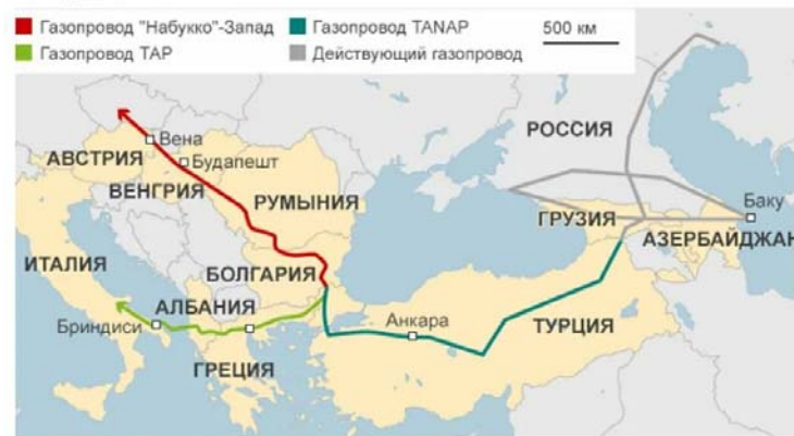
Трансанаатолийский газопровод из Азербайджана на Запад в обход России - TANAP

در سال ۲۰۱۴، پس از اعمال تحریم‌های «کریمه» از سوی بروکسل علیه مسکو، حسن روحانی، رئیس‌جمهور وقت ایران در حاشیه مجمع عمومی ملل متحد هنگام دیدار با همتای اتریشی خود، هاینز فیشر گفت که کشورش می‌تواند به «منبع قابل اعتماد گاز» برای اروپا به میزان ۱۰ تا ۲۰ میلیارد مترمکعب در سال تبدیل شود. مجید چگنی معاون وزیر نفت ایران در ماه مه سال ۲۰۲۲ اعلام کرد که ایران «... در حال بررسی امکان صادرات گاز به اروپا است. ما در حال بررسی این موضوع هستیم اما هنوز به نتیجه‌ای نرسیده‌ایم. ایران همواره طرفدار توسعه دیپلماسی انرژی و توسعه بازار بوده است.»