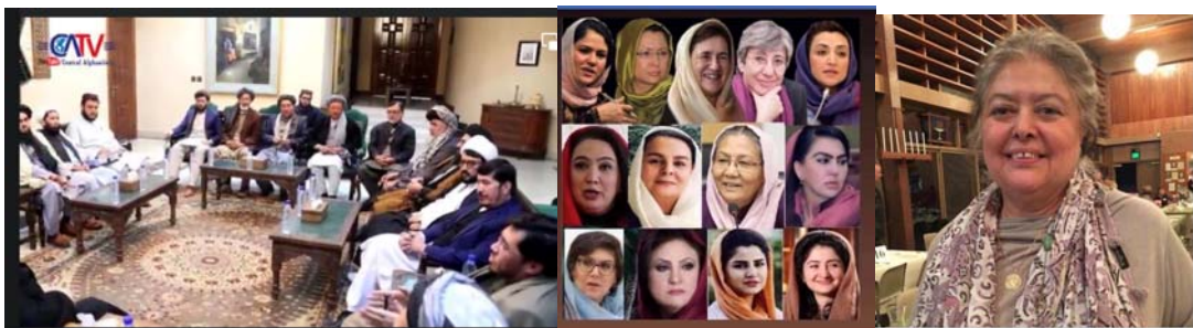
وطنفروشان و مرده های در انتظار مرگ!

اینها با همه جنایات شان زمانی که مردند تعدادی از چاپلوس ها و یا کسانی که حافظه تاریخی شان در ماتحت شان پنهان است و یا هیچ شعور و آگاهی ندارند در رثای جنایتکاران خاین مداحی می کنند اما از جنایات شان صحبتی نمی کنند نسل آگاه و تاریخ کشور همه جنایات شان را در اوراق زرین خود ثبت کرده تا نسل آینده فریب شارلاتان هائی مانند آنها را نخورند.