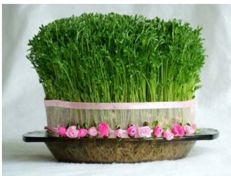
سبزه سفره هفت سین

این روز مصادف با سیزدهم فروردین است. در قدیم باور داشتند برای راندن نحسی باید از خانه خارج شد و در دامان طبیعت جشن گرفت. در تقویم ایران این روز را روز طبیعت نام‌گذاری کرده‌اند.