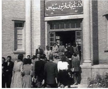
آذربایجان اونیورسیتیه سی / دانشگاه آذربایجان

روزنامه وارهایت چاپ برلین غربی در گزارشی در ۲۵ مهرماه که به مناسبت شروع سال تحصیلی این دانشگاه در ۲۰ مهر منتشر کرد: «یک سوم بودجه سالانه دولت آذربایجان به این مهم اختصاص داده شده و این از همه بودجه اختصاص داده شده به کل آذربایجان در دوره شاهنشاهی به مراتب بیشتر بود و اعتبار آن از محل مالیات و کمک‌های مردمی و مساعدت فرهنگ دوستان آذربایجان تامین شده بود.» (۳۰) تاسیس دانشگاه آذربایجان، انحصار دانشگاه تهران را در ایران شکست. لزوم و امکان تاسیس دانشگاه در سایر استانها و نقاط کشور را به اثبات رساند.