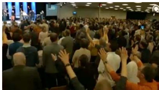
Coronavirus: The church threatened with Kalashnikovs over Covid-19 outbreak

مردم وحشت زده و مرددند. مدارس خالی، فرودگاه ها خالی، بقالی های ورشکسته. در فرانسه، « کلیساها با کلاشنیکف به علت کووید-۱۹ تهدید می شود» (اپریل ۲۰۲۰)