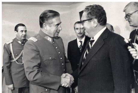
هنری کیسینجر با ژنرال اوگوستو پینوشه (سال های ۱۹۷۰)

به عنوان استاد دعوت شده به دانشگاه کاتولیک شیلی، شخصاً شاهد کودتای نظامی بودم که علیه دولت سالوادر آلنده که به شکل دموکراتیک برگزیده شده بود به راه افتاد. ماجرا مربوط بود به عملیات سازمان سیا به رهبری وزیر امور خارجه امریکا هنری کیسینجر در پیوند با اصلاحات کلان اقتصادی ویرانگر.