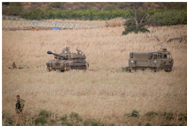
تجهیزات نظامی اسرائیلی در بلندی های جولان اشغالی

https://hamodia.com/2020/07/31/gantz-instructs-idf-bomb-lebanese-infrastructure-hezbollah-harms-soldiers-civilians/