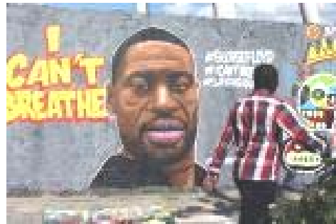
جورج فلویید در اثر هنری جدید بنکسی: این مشکل سفیدپوست‌هاست