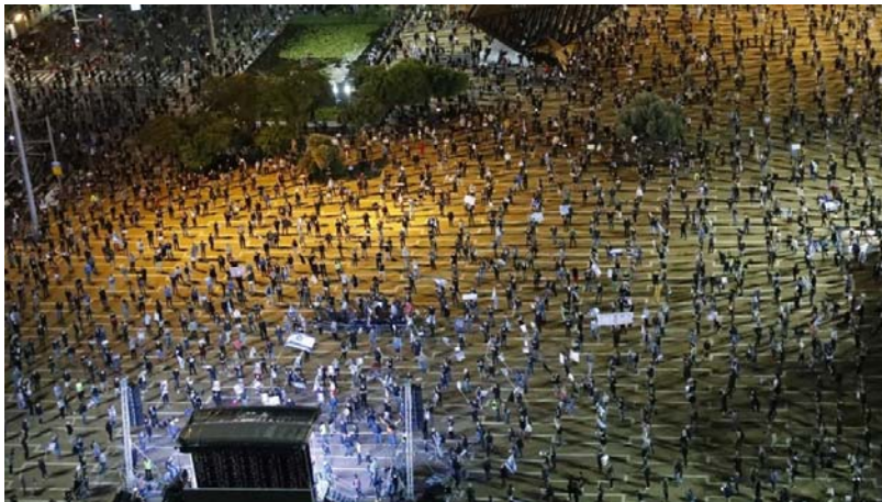
تظاهرات در تل آویو با حفظ فاصله اجتماعی، ۱۹ اپریل ۲۰۲۰

Distanziamento sociale dalla democrazia il manifesto Édition de mardi 21 avril 2020 d'