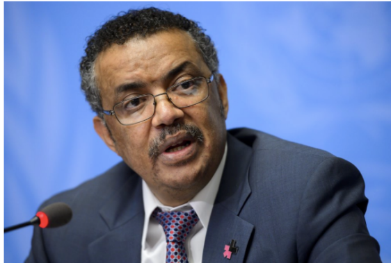
Tedros Adhanom Ghebreyesus in 2016. He has been accused of covering up cholera outbreaks by an associate of a rival for World Health Organization director general.

اردوی توسعه واکسن از سوی دبیر کل سازمان جهانی بهداشت تدریس ادهانوم راه اندازی شد، پیش از این چندین شرکت داروسازی روی آن کار می کردند ۱۱ . به همین روی، لازم به یادآوری اختلاس سازمان جهانی بهداشت است، زیرا در طول ریاست دبیر کل اسبق دکتر مارگارت چان ۱۲ درباره بیماری همه گیر گریپ خوکى H1N1 در سال ۲۰۰۹ گفته است : « تولید کنندگان واکسن می توانند در بهترین حالت ۴،۹ میلیارد واکسن ضد گریپ در سال تولید کنند.» ۱۳ (مارگارت چان، دبیر کل سازمان جهانی بهداشت، نقل قول در رویترز ۲۱ جولای ۲۰۰۹)