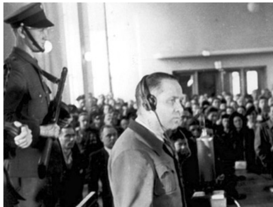
رودلف هس به هنگام دادگاه نورنبرگ

در پایان سال ۱۹۴۱ ، زمانی که تمام شرایط امتحان شد و زمانی که اشغال اتحاد جماهیر شوروی برای آنها به صورت یک کابوس در آمد ، آنها به فکر "راه حل نهائی" افتادند که قتل عام توده ها بوده است .