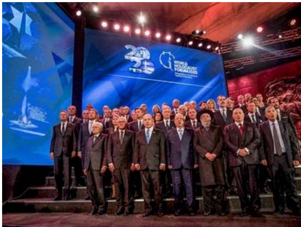
مراسم یادبود هفتاد و پنجمین سالگرد آزادی اردوگاه آشویتز

بومیان از سرزمینشان بوده است و نه قتل عام آنها و آهسته با ادغام زمین ها، می خواهد سرزمین فلسطین را از دست بومیان که اعراب فلسطینی هستند در بیاورد . برخی از اعراب فلسطینی در سال ۱۹۴۸ ملیت اسرائیلی را دریافت کردند و هم اکنون یک پنجم جمعیت آن به حساب می آیند . بینامین ناتانیاهو از حزب لیکود ، اسرائیل را "دولت یهودی" نامیده است . و به طور رسمی سلسله مراتبی برای شهروندان قائل شده است و دولت خود را در این تقسیم بندی ها دخیل کرده است . این همان منطق دو دولت است که نخست وزیر حزب کارگر اسحاق رابین پیشنهاد داده بود که "راه حل دو دولت می باشد" . به صورتی که اقوام و نژاد ها از یکدیگر جدا باشند . هنوز فرصت بازنگری بر این راه حل وجود دارد .