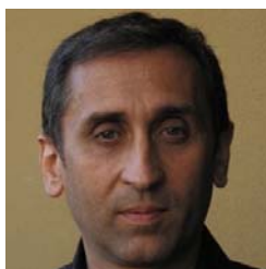
تی یری میسان