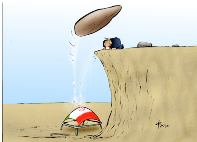
ترامپولین، کاریکاتور از پائولو کالری

نخواهد کرد و در صورتی که به تحریم های امریکا پایان داده شود حاضر است همچنان به همه محدودیت ها پایبند باشد. [۱] سازمان بین المللی انرژی اتمی تأیید می کند که تا امروز ایران در مورد اعلان ۵ جنوری هیچ گونه اقدام عملی انجام نداده است. این در حالیست که عکس العمل ایران از هر جهت مطابق مواد قرارداد هسته ای است که مطابق ماده ۲۶ آن: "ایران اعلان نمود که تجدید یا عملی نمودن تحریم ها را مسبب آن خواهد دانست که به تعهدات مربوط به قرارداد، به کلی یا محدوداً پایان دهد". [۲] اعلان ۵ جنوری مبتنی بر این ماده می باشد.