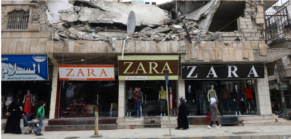
تحریم علاوه بر جنگ زدگی: تلاشی اقتصاد سوریه (منبج ۱۰ ماه مه ۲۰۱۸)

در ۲۱ نومبر ۲۰۱۹ کمیته ثنوی امور اقتصادی و مالی در ملل متحد به بررسی پیرامیون حقانیت تحریم های یک جانبه پرداخت. ۱۶ متن برای قطعنامه مطرح بود که دو تای آنها تصویب گشت. یکی از این دو، جامعه بین الملل را به محکوم نمودن تحریم های اقتصادی، مالی یا تجارتي فراخواند، زیرا مانع سازندگی و پیشرفت کشورها هستند. جریمه هائی که از جانب ارگان های ملل متحد مقرر نشده باشند، باید لغو گردند. در ادامه قطعنامه مزبور آمده که اینگونه اقدامات با حقوق بین الملل ناسازگار بوده و ناقض اصل نظام اقتصادی بین الملل است. ۱۱۶ کشور عضو ملل متحد بدان قطعنامه رأی مثبت دادند؛ دو کشور رأی منفی دادند: ایالات متحده امریکا و اسرائیل و ۵۲ کشور، شامل بر کشورهای عضو اتحادیه اروپا، از جمله المان، بدان رأی ممتنع دادند.