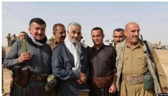
قاسم سلیمانی فرمانده نیروی قدس سپاه در میان نیروهای عراقی

حکومت اسلامی ایران با تمام قوا از ائتلاف شیعی حاکم به ساختار فرقه‌گرای حکومت عراق یاری رسانده است. به‌علاوه، نظام سیاسی ایران با ایجاد و تقویت و گسترش شبه‌نظامیان شیعی در عراق، زمینه نفوذ خود در این کشور را فراهم آورده که خود یکی از عوامل بی‌ثباتی و ناکارآمدی در عراق است. این نیروها در بسیاری موارد به دستگیری شهروندان عراقی و ترور دست می‌زنند.