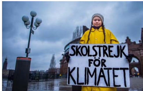
گرتا با پلاکاردی روبروی پارلمان سویدن در سال ۲۰۱۸

در واقع تونبرگ وقتی تنها ۱۵ سال داشت، اعتصاب‌های تک نفره خود را در اوت ۲۰۱۸ آغاز کرد. او به جلوی پارلمان سویدن می‌رفت. پلاکاردی در دست داشت که روی آن نوشته شده بود: «اعتصاب مدارس برای تغییرات آب و هوایی.»