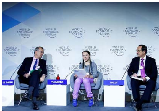
گرتا تونبرگ در مجمع داووس سوئیس

گرتا بعد از این که به چهره معروفی در رسانه‌های دنیا تبدیل شد، سفرهای خود را نیز شروع کرد. یکی از نخستین سفرهای او به داووس سوئیس در ژانویه ۲۰۱۹ بود جایی که مقامات ارشد دولت‌ها و تاثیرگذارترین افراد جهان برای شرکت در مجمع جهانی اقتصاد در آن جمع شده بودند.