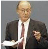
پروفسور میشل چوسودوفسکی

نویسنده: پروفسور میشل چوسودوفسکی برگردان از: آمادور نویدی 23 جولای 2019