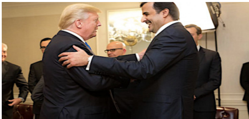
ترمپ و امیر قطر، مجمع عمومی ملل متحد، اکتوبر ۲۰۱۷، عکس کاخ سفید

این یک شکست ژئوپولیتیک مطلق است. پس این چه نوع اتحادی‌ست؟