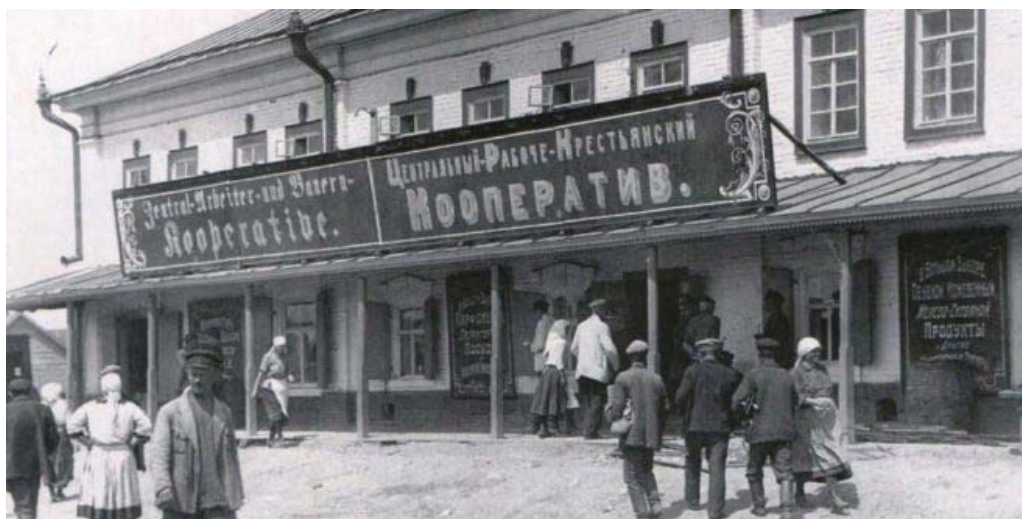
The Co-operative Shop in Baltsev in the 1920s

کمونیسم جنگی؛ کمونیسمی بود که در زمان جنگ جهانی اول و مبارزه با ضد انقلاب گارد سفید در شوروی برقرار بود. دولت شوروی در این دوران برای تأمین مخارج جنگ داخلی و خارجی نیاز به این داشت که مازاد محصول دهقانان را از آنها اخذ نماید و برای مصارف جاری به مصرف برساند. هر چه دهقانان تولید می‌کردند، به جز بخشی که خود برای سد جوع احتیاج داشتند از آنها اخذ می‌شد. این وضعیت تا زمانی که جنگ جهانی اول و سپس جنگ داخلی در مجموع به مدت ۷ سال ادامه داشت و دهقانان از بازگشت مالکان و بازگشت به وضع سابق هراس داشتند، به عنوان یک رویه معقول؛ حتی برای خود دهقانان قابل پذیرش بود. کمونیستها حتی در این زمینه به زیاده‌روی پرداختند و موجبات نارضائی دهقانان را فراهم آوردند. لنین می‌گفت که ما در این تعرض زیاد به‌جلو رفته‌ایم و حال برای آن که از پشت جبهه منزوی نشویم باید به عقب‌نشینی تن در دهیم تا خود را برای تهاجم بعدی آماده کنیم. ولی با تغییر شرایط بعد از سرکوب آشکار ضد انقلاب بایست در روش کمونیستها متناسب با شرایط روز