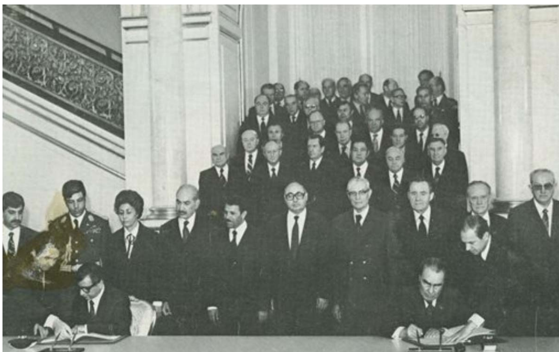
بیرک وطنفروش حین امضای قرارداد فروش افغانستان به شوروی آنزمان

این کار را که همه ملت غیور و قهرمان مقابل اتحاد جماهیر شوروی و نوکران زرین قلاده باند های خلق و پرچم انجام داده اند نه تنها ارگ نشینان بلکه مسکو و جهان را به لرزه در آورده بار دیگر در تاریخ مبارزات آزادیخواهانه ثبت گردید که افغان جان می دهد، مگر وطن نه. آن حرکت شکوهمند که امروز تعدادی از مزدوران ایران و پاکستان قصد دارند آن را به نفع خود مصادره نمایند، بر مبنای شب نامه ها اما در کل حرکت خود جوش مردمی بود که در سرک و کوچه اش نمی توانست موجودیت اشغالگران روسی را تحمل نمایند و هیچ ارتباطی به نوکران ایران و پاکستان و ارتجاع منطقه و امپریالیست های رقیب آنروزی روسها نداشتند.