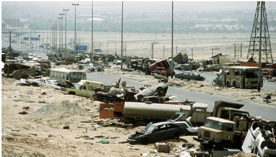
Fahrzeugtrümmer auf dem Highway 80, auch bekannt als „Highway of Death“ (Fluchtroute irakischer Streitkräfte aus Kuwait), die im Verlauf der US-Operation „Desert Storm“ im Februar 1991 bombardiert wurden.

Im Golfkrieg von 1991 vollzog der US-Imperialismus eine scharfe Hinwendung zum Unilateralismus und Militarismus. Sie war mit der langwierigen Krise des amerikanischen Kapitalismus und dem relativen Rückgang seiner Kontrolle über die Weltwirtschaft verbunden. Seit den 1970er Jahren waren amerikanische Unternehmen mit der Konkurrenz ihrer europäischen und japanischen Rivalen konfrontiert. Mit dem Untergang der UdSSR kam der US-Imperialismus zum Schluss, dass er nun dieser Herausforderung relativ ungehindert durch den Einsatz seiner Streitkräfte entgegenreten könne.