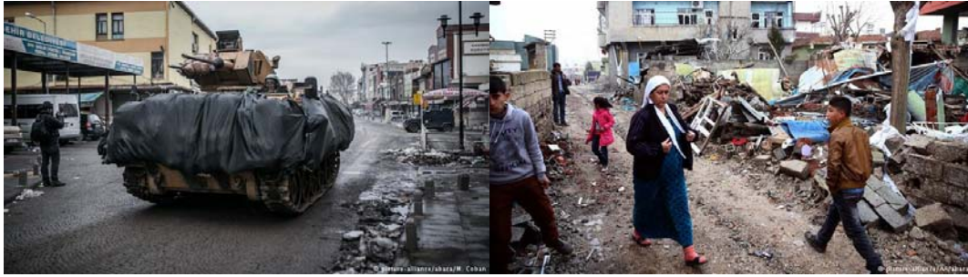
تانک در سور، واقع در استان دیار بکر در ۱۱ ژانویه ۲۰۱۶ - سیلویی، واقع در استان شیرناک پس از یک حمله ارتش ترکیه - ۱۹ ژانویه ۲۰۱۶

روز پنجشنبه ۲۱ ژانویه ۲۰۱۷، جان دالھویزن، رئیس بخش اروپا و آسیای مرکزی از دولت ترکیه به دلیل حمله‌های نظامی به استان‌های کردنشین این کشور انتقاد کرد. دالھویزن گفت: «شکی نیست که دولت ترکیه با استفاده از خشونت بیش از حد، زندگی ده‌ها هزار نفر را به خطر انداخته است.»