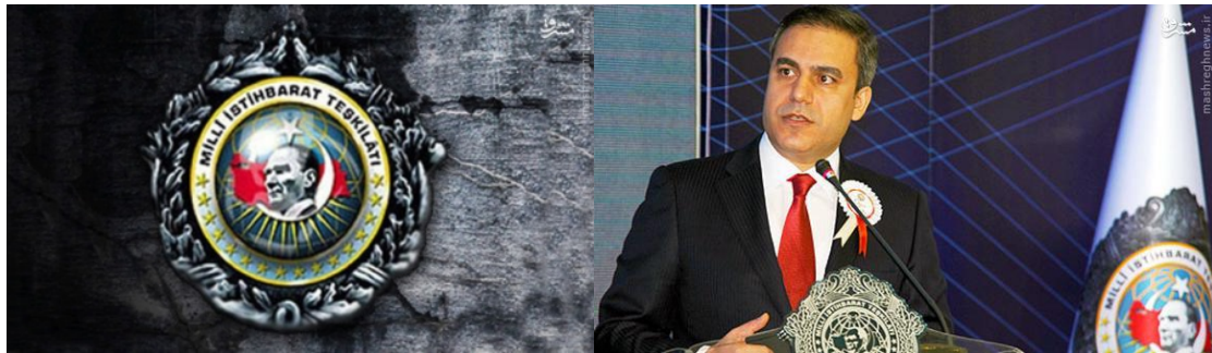
هاکان فیدان رئیس MIT

سازمان امنیتی اطلاعات و امنیت ترکیه (میت)، یکی از سازمان‌های مخوف پولیسی است که تاریخچه اصلی تأسیس آن به اواخر فروپاشی امپراطوری عثمانی و سازمان‌دهی «ترک‌های جوان» برمی‌گردد. «میت» (Milli İstihbarat Teşkilatı) سازمان امنیت داخلی و برون مرزی ترکیه است و دیگر سازمان‌های اطلاعاتی ترکیه شامل اسامی ذیل، تحت نظر آن قرار دارند.