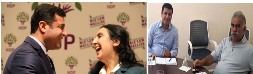
دیدار دمیرتاش در زندان با اوجالان - صلاح‌الدین دمیرتاش و فیگن یوکسک داغ شن‌اوغلو، رهبران حزب دموکراتیک خلق‌ها

حزب دموکراتیک‌ها خلق‌ها، با وجود اتهاماتی که اردغان در تبلیغات انتخاباتی به این حزب نسبت می‌داد با این وجود، در انتخابات زودهنگام پارلمانی ترکیه در نوامبر ۲۰۱۵ توانست با کسب بیش‌تر از ۵ میلیون رای، نزدیک به ۱۱ درصد آرا را به‌خود اختصاص دهد.