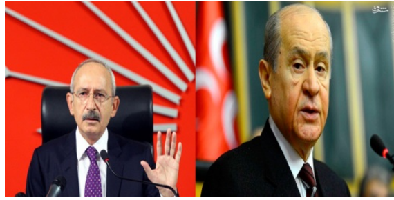
دولت باغچه‌لی (سمت راست) و کمال قلیچ‌دار اوغلو (سمت چپ)

از مواد این قانون می‌توان به موارد زیر اشاره کرد: