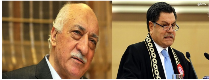
هاشم قلیچ (سمت راست) و فتح‌اله گولن (سمت چپ)

ترکیه را به فساد مالی و ایجاد شکاف در سیستم قضائی کشور متهم کرده است، از دیگر عواملی است که تلاش اردوخان برای تصویب لایحه یاد شده را توجیه می‌کند.