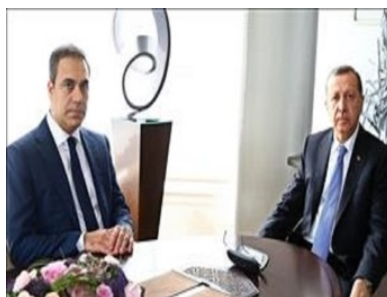
اردوخان و فیدان

سازمان اطلاعات ملی ترکیه با حکم حکومتی و در چارچوب قانون وضعیت اضطراری ترکیه زیر نظر نهاد ریاست جمهوری قرار گرفته است. طبق گزارش برخی رسانه‌ها، دولت ترکیه در چارچوب وضعیت اضطراری در کشور قانونی دیگر وضع کرده است که می توان گفت یکی از مهم ترین قانون‌های یک سال اخیر در وضعیت اضطراری است.