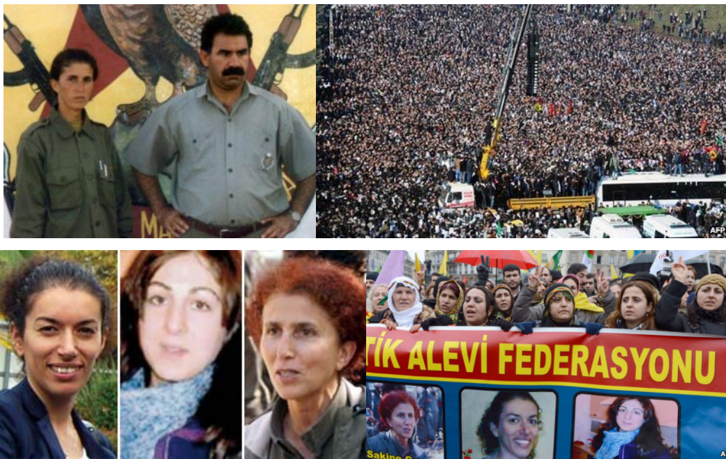
موجی از حضور مردم در مراسم تدفین سه فعال پکک در پاریس

یکی از اقدامات تروریستی اردوخان و میت در سال ۲۰۱۳، ترور سه فعال کرد در دفتر کارشان در پاریس است. هر سه عضو پکک بودند. در حالی که امریکا و ترکیه، پکک را گروه تروریستی می‌دانند، آن زمان ترکیه در سطح بالائی مشغول گفتگوهای صلح با اوجالان و پکک بود.