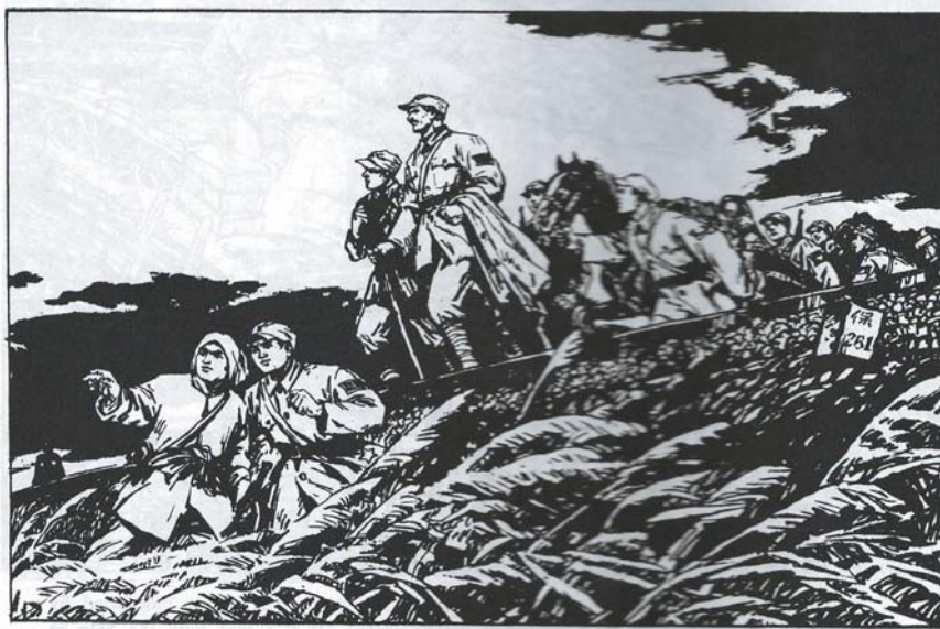
روغتیایي تیم د خلکو په ملاتړ د دښمن له محاصري په سلامتی تیر شو.