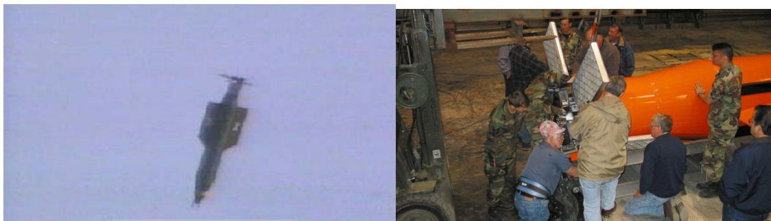
مراحل پرتاب آزمایشی «مادر همه بمب ها» در سال ۲۰۰۳ میلادی در فلوریدای امریکا

ارتش امریکا برای اولین بار، در آوریل ۲۰۱۷، یکی از بزرگترین بمب های غیر هسته ای خود را در جنگ استفاده کرد. هدف این بمب به گفته امریکا مخفیگاه زیرزمینی گروه موسوم به «دولت اسلامی» یا «داعش» در ولسوالی اچین ولایت ننگرهار افغانستان بوده است. اما این بزرگترین و سنگین ترین بمب امریکا نیست. با توجه به این که این بمب غیر هسته ای است، استفاده از آن لزوما نیاز به اجازه رئیس جمهوری امریکا ندارد. نام اصلی این بمب (B۴۳ BGU-) سلاح عظیم انفجار هوایی (Massive Ordnance Air Blast Bomb) یا به اختصار (MOAB) است که به اصطلاح به آن مادر همه بمب ها گفته می شود. این بمب ۹ متر طول و نزدیک به ۱۰ تن وزن دارد و هدفش را با موقعیت یاب ماهواره ای (جی پی اس) پیدا می کند. برای افزایش قدرت انفجار این بمب، به آن پودر آلومینیم اضافه کرده اند. نحوه پرتاب این بمب متفاوت است. به دلیل سنگینی و بزرگی، بجای بمب افکن، یک هواپیمای باربری ام سی-۱۳۰ آن را پرتاب می کند. فیلم زیر مراحل یک پرتاب آزمایشی را در سال ۲۰۰۳ میلادی در فلوریدای امریکا نشان می دهد.