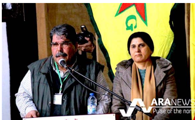
رهبر حزب اتحاد دموکراتیک هنوز در میان واشینگتن، مسکو و دمشق سرگردان است

خصوصیت خاص آنکارا نسبت به کردهای سوریه و رد هر گونه استقلال آنها با این توضیح داده می‌شود، که آنها به لحاظ قومی و سیاسی با کردهای ترکیه بسیار نزدیک هستند. حزب اتحاد دموکراتیک به رهبری صالح مسلم، پیشروترین نیروی سیاسی کردها در سوریه با حزب کارگران کردستان (پ پ ک) که ترک‌ها آن را در رسته سازمان‌های تروریستی طبقه‌بندی کرده‌اند، در ارتباط بسیار نزدیک می‌باشد. امریکائی‌ها نیز به رغم موافقت با این، با حزب اتحاد دموکراتیک همکاری می‌کنند.