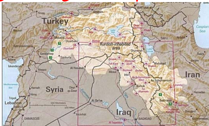
نقشه مناطق کردنشین در خاورمیانه

سرنوشت تاریخی کردها، یکی از خلق‌های بزرگ جهان (۳۰-۴۰ میلیون نفر) محروم شده از دولت خود، فاجعه‌بار رقم خورده است. در صد سال گذشته دو بار در پایان جنگ‌های جهانی اول و دوم، آنها به کسب استقلال ملی نزدیک بودند، اما هر دو بار در نتیجه مداخله نیروهای خارجی این امید آنها بر باد شد. ابتداء انگلیس‌ها به منظور تأمین منافع استعماری خود از قبایل کرد در مبارزه علیه امپراتوری‌های متحد المان و ترک استفاده کردند و بعد با قدرت اسلحه تلاش‌های استقلال‌طلبانه آنها را ناکام گذاشتند. بار دوم، همان انگلیس‌ها همراه با امریکائی‌ها کردها را به مبارزه با نفوذ هیتلری به ایران و عراق تحریک نمودند، اما پس از شکست رایش سوم به دولت‌های این کشورها در سرکوب دولت اولیه کردها (مثلاً، جمهوری مهاباد) کمک نمودند و به این ترتیب تاریخ تکرار می‌شود. باز هم آنگلساکسون‌ها (این بار، قبل از همه، امریکائی‌ها) از کردها به مثابه ابزاری برای تأمین منافع ژئوپلیتیک خود در خاورمیانه استفاده می‌کنند و هیچ تضمینی وجود ندارد، که کردها، به رغم تجارب تاریخی غم‌انگیز خود، بار دیگر به تله نیفتند.