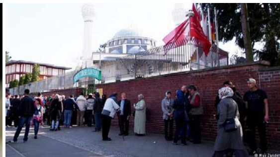
مسجدی در المان

رجب طیب اردوخان، رئیس‌جمهور ترکیه، فتح‌الله گولن را عامل اصلی کودتای نافرجام در ژوئن سال میلادی جاری در این کشور می‌داند. بنا به نوشته «برلینر تسایتونگ» کنسولگری ترکیه در برلین و جامعه مسلمانان ترک در المان (DITIB) تا کنون پاسخی به پرسش‌های خبرنگار آن نداده است. DITIB (تشکل سراسری ۹۰۰ مسجد در المان)