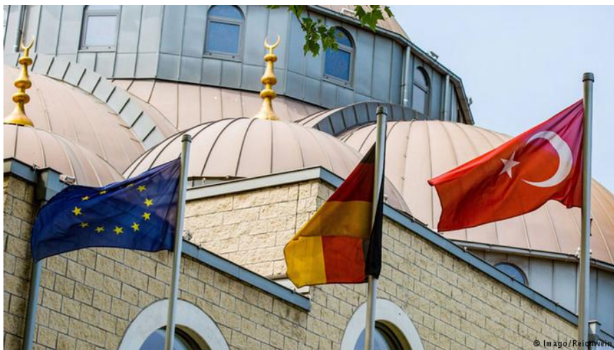
مسجدی در دویسبورگ که با پشتیبانی مالی دی‌تیب ساخته شده است

گریزه با اشاره به مسئولیت این شبکه در رابطه با امامانی که در خطبه‌های نماز خود نفرت و خشونت ترویج می‌کنند، گفت: «در صورت لزوم این امامان باید از المان اخراج شوند.»