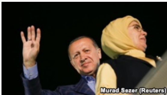
اردوخان با همسرش

این روزنامه پرتیراژ، همچنین می‌نویسد که «اداره دیانت» ترکیه از ماه سپتامبر به کارمندان خود دستور داده است درباره مواضع سیاسی امامان جماعت، آموزگاران، اعضای هیأت‌اجرائی انجمن‌ها و نهادهای فرهنگی فعال در برلین تحقیق کنند و رابطه آن‌ها را با شبکه سراسری هواداران فتح‌الله گولن، رهبری مذهبی جنبشی به همین نام مورد بررسی قرار دهند. در گزارش یادشده آمده است که کپی بخشنامه «اداره دیانت» به دفتر روزنامه ارسال شده است.