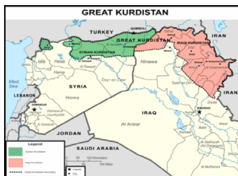
نقشه کردستان بزرگ

مرکز رسانه درون سوریه اثبات طرح ایجاد کشور کردستان بزرگ را به دست آورده است.